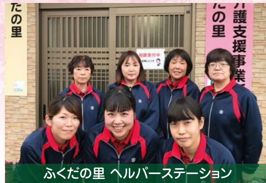
ふくだの里 ヘルパーステーション