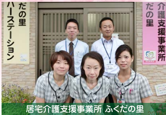
居宅介護支援事業所 ふくだの里

要支援認定を受けた方も地域包括支援センターから委託を受け、同様のサービスを提供しています。利用者様が住み慣れた地域で自分らしく生活していただけるようにお手伝いするのがわたしたちケアマネジャーの役割です。「サービスを利用するにはどうしたらいいの?」「どんなサービスが受けられるの?」などといった質問や疑問、お困りごとがありましたらお気軽にご相談ください。ヘルパーステーションでは介護福祉士をはじめ、ベテランヘルパーが揃っておりプロのケアを行っております。