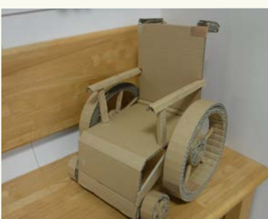
ダンボール車いす

2000年入社で介護保険の開始と同時に広 島常光福祉会にお世話になる事になりました。 がむしゃらに仕事に打ち込むあまり、奥さんを もらい損ねて(笑)いつの間にか18年という年月 が過ぎ去ってしまいました。そのがむしゃらな仕 事の中で、作業療法士という職業柄もあり、『モ ノづくり』に夢中になると共に、一番得意としてい ます。 リハビリの二環としても利用できる、いわゆる 手芸作品から組み紐や革細工に籐細工、そして 今は廃材からモノを作り出す事が一番面白い かもしれません。この18年の仕事の中で様々な物 を作る事が出来ました。神社の鳥居、社殿に賽銭 箱、ペットボトルツリー、割り箸での錦帯橋、柱か ら天井にかけてうっそうと茂る大木、張りぼての 獅子頭に雪だるま や招き猫等も誕生 させました。