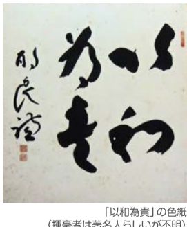
「以和為貴」の色紙 (揮毫者は著名人らしいが不明)

住民100名、価値観100通りの「ラポーレ東千田」に住んで一年半が経過。何もせず個室に籠ってテレビにしがみついていては、足腰が弱るし、ストレスもたまるので、毎日散歩に出かけて発散している。散歩している4コースを開拓、車では見落としていた「宝物」を次々発見。好奇心旺盛もポケ防止の余録になっている。館内では、名画座・音楽喫茶・パソコンサークルと週三日はつづれ愚痴っている暇はない。廊下二つ隔てた向こう三軒両隣や、階上・階下の住人たちとも摩擦を生じないよう心掛け、笑顔で日々を送っている。現役時代、勤め先の創業者は、自ら「笑顔が苦手」と贈答品に「大型の鏡を特注。額縁に「朝の挨拶、まず笑顔」と彫刻入り。毎朝鏡に向かって「こっ」と笑顔の練習!」(簡単なようでも意外に難しかったと記憶)私の一日は、併設の保育園のちびちゃんに憧れ、朝手を振って笑顔で挨拶することから始まる。とかく、高齢者は「怒りっぽく、切れる病」、他人の話を聞かない病、「して呉れない病」に罹りやすい。「顔施」という教えもあるとおり、「笑顔」が創る「和こそ、コミュニケーションの潤滑油と感じているこの頃である。さあ、今日も職員さんの笑顔に見送られ、皆さん元気で散歩に出かけませんか!