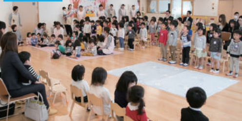
問 サンヒルズ保育園 082-289-7688